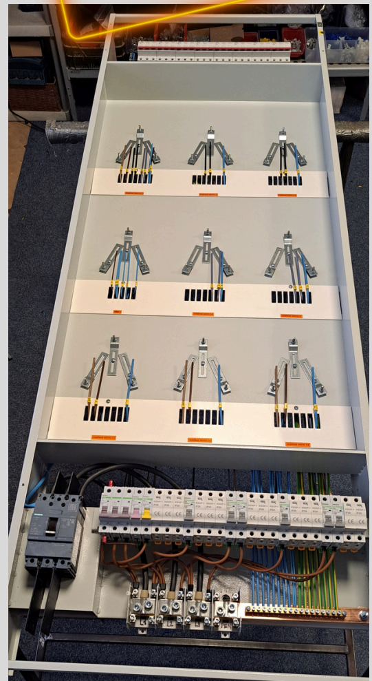
Vložka s Total Stopem